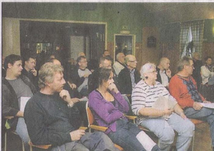
Mycket missnöjda. Holmaborna som deltog i samrådsmötet var eniga – de vill inte ha någon ny busshållsplats utanför samhället utan vill behålla den nuvarande.